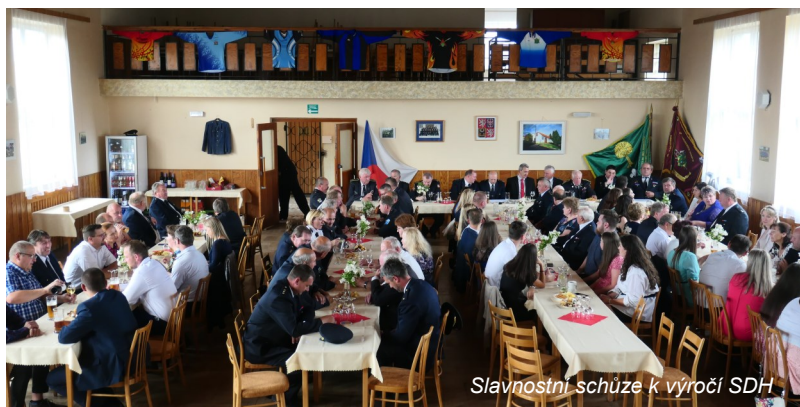
Slavnostní schůze k výročí SDH