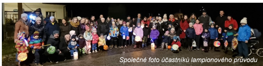
Společné foto účastníků lampionového průvodu