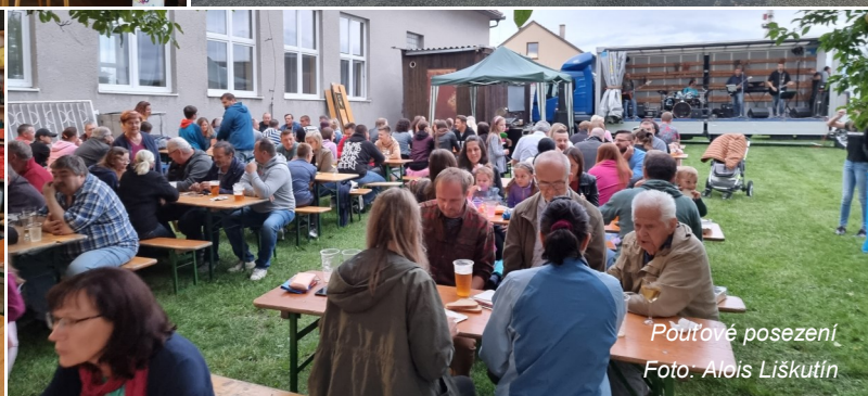
Pouťové posezení