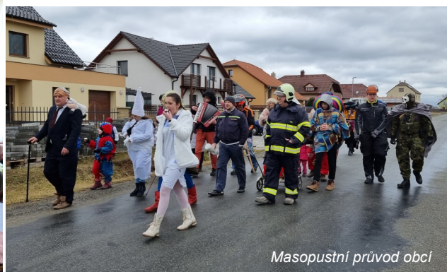
Masopustní průvod obcí