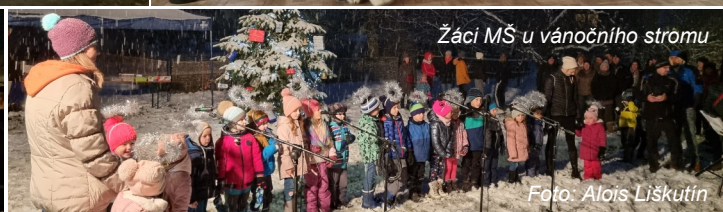
Žáci MŠ u vánočního stromu