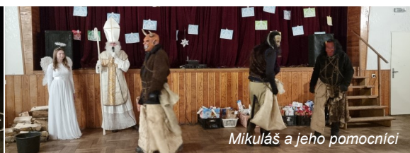
Mikuláš a jeho pomocníci