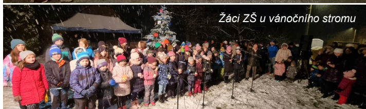
Žáci ZŠ u vánočního stromu